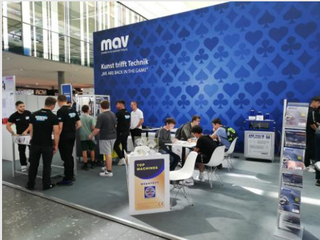
2022: AMB – We are back in the Game

Seit Jahren geschätzter und etablierter Bestandteil der AMB in Stuttgart