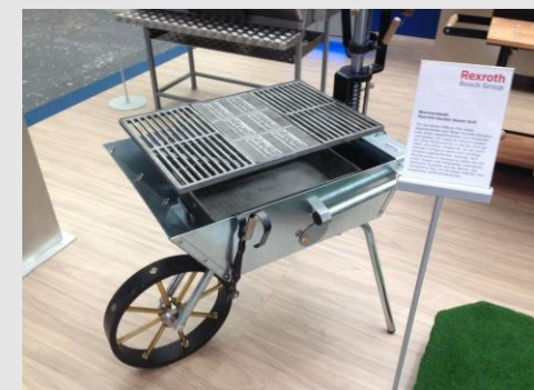
... 2014, 2012, 2010