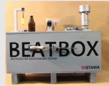
2020: AMB – Tonangebend in der Branche