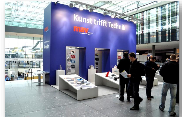
Platten-Aktion, AMB 2010

Die besten drei Platten werden bei unserer Preisverleihung am 19.09.2026 im Atrium der Messe Stuttgart (Eingang Ost) prämiert, wozu wir alle Teilnehmenden recht herzlich einladen.