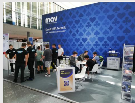
2022: AMB – We are back in the Game