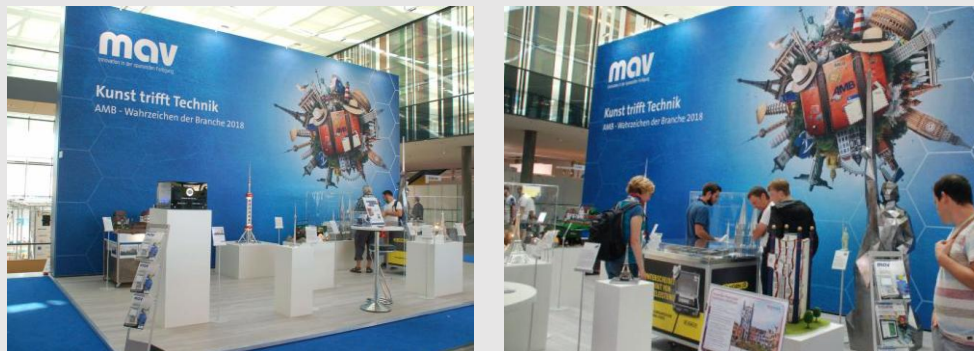
2018: AMB – Wahrzeichen der Branche