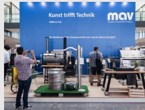
2016: AMB on fire – Grillwettbewerb