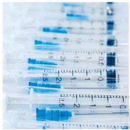
Nachhaltigkeit: KI, Netzwerk und Experten